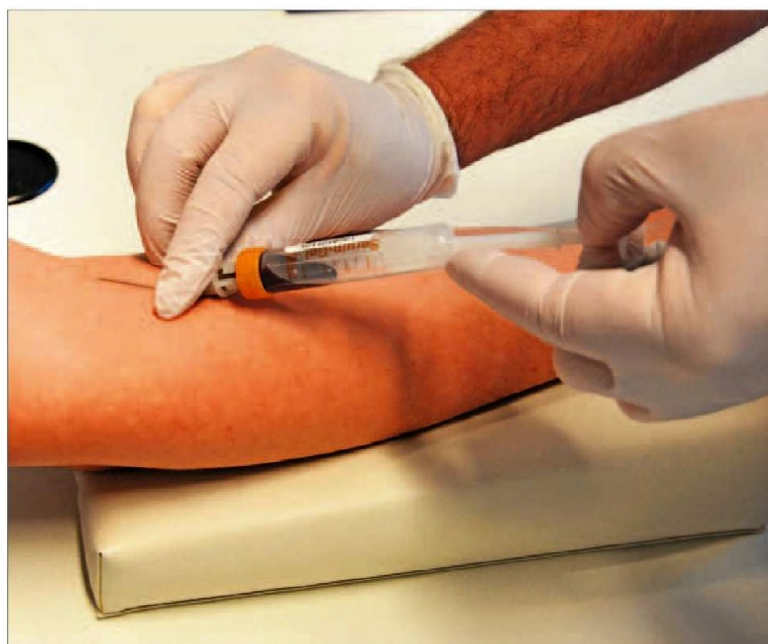
Immer weniger Menschen spenden Blut. Deshalb müssen Kliniken umso sorgsamer mit den Konserven umgehen.

Neben der präventiven Diagnostik vor der Operation wird auch während des Eingriffs darauf geachtet, kein